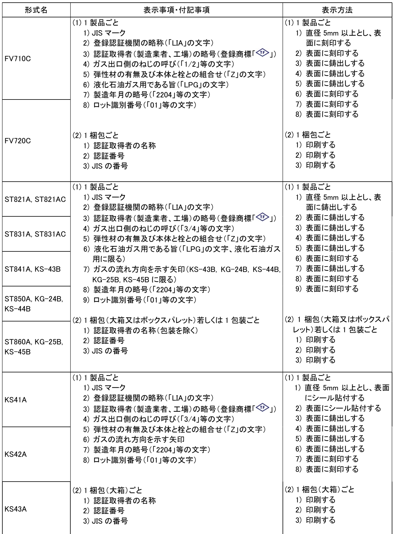
別表 2 表示事項、付記事項及び表示方法 (1/2)